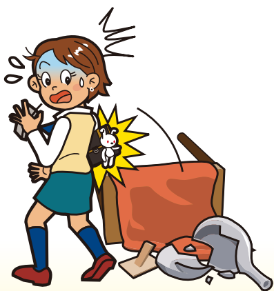
ショッピング中に お店の商品を壊してしまった。