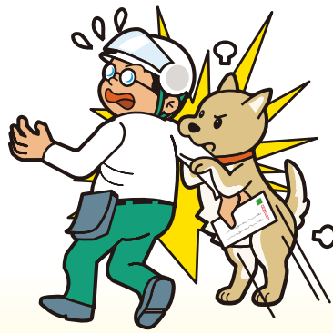
飼犬が他人にかみついて ケガをさせてしまった。