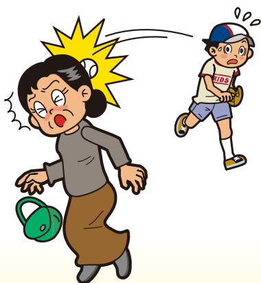
キャッチボールで暴投し、 通行人に当たってしまった。