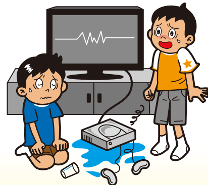
テレビゲームで遊んでいて、 友達のゲーム機を壊してしまった。

その他、自宅マンションの水道栓を締め忘れたため階下に水漏れしてしまった。 ゴルフのプレイ中、他人にケガをさせてしまった...等